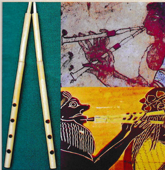
1. kép - Széttárt szárú kettőssípok (sumér, etruszk, görög)

A régebbi típusú sípok dallamsípján négy hangnyílás volt, a kísérésípon három. A két síp hangjai egymást kiegészítő ellentétpárként hozzák létre a harmóniát.