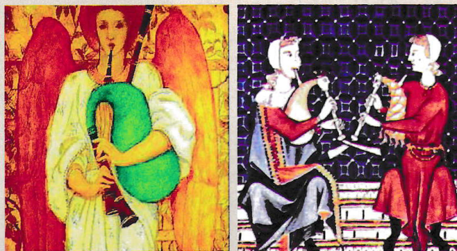
Kettős sipszárú dudu (Skócia) és Cornemuse (Franciaország). 15. század.