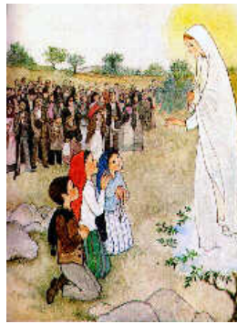
A Fatimai Jelenés

Az Isteni ősanya ÉLŐ ŰNŐ, a mi Tündér Ilonánk , a görögök Helénája , és a szlávok Jelenája rendszerint szarvasűnő alakban jelenik meg. Jelenés szavunkat innen származtathatjuk. A jelenés minden esetben Istenői megnyilvánulás. Korábban csodaszarvas képében történt a szent helyek kijelölése, majd — a kereszténység széleskörű elterjedése után — a Mária-jelenések sorozata következett.