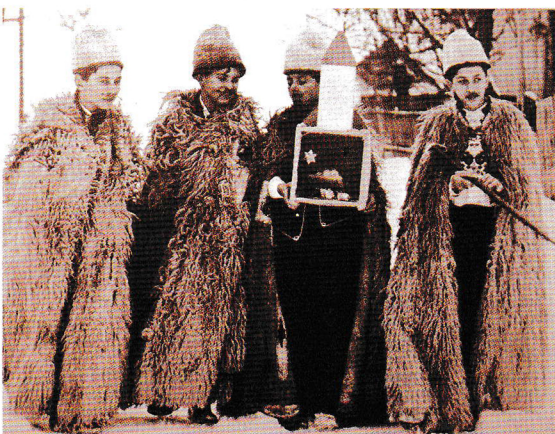
Betlehemesek (Szakmár, Bács- Kiskun megye)