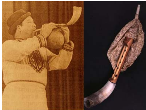
Cseremisiz hólyagdudás – avar duda rekonstrukciója

A késő-avar korból származó dudafújó csontcsövecskék nagy száma arra utal, hogy a hólyagduda általánosan használt és elterjedt hangszer lehetett ebben az időben. Az ezzel rokon magyar duda hagyományának kezdetei — ezek szerint — a hetedik századig nyúlnak vissza.