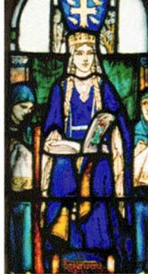
Skóciai Szent Margit képe Edinbourghan a St Margaret kápolna üvegablakán

A messzi Albion esőverte szigetére nyilván nem magányosan érkezett a szépséges aranyhajú királyleány, hanem több száz fős udvartartással, így a derék skótoknak (távoli kelta rokonainknak) alkalmuk nyílhatott a sosem látott, sosem hallott magyar kultúra rejtelseibe bepillantani. A vele áttelepült magyar nemesek utódai máig számon tartják magyar származásukat. Margit királynét 1251-ben avatták szentté. A hagyományok szerint általa indult meg Skócia felemelkedése a barbarizmusból. Magyar szokások egész sorát vezette be az udvarnál, és állítólag a híres skót kockás szőttest is általa ismerték meg, hiszen a vászonszövés mesterségének megismertetése is az ő nevéhez fűződik.