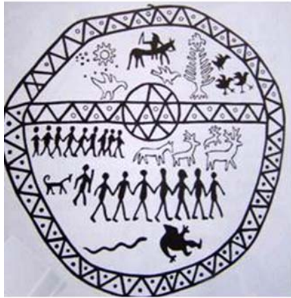
Sór sámándob rajza (Hoppál Mihály)

jól sikerült; a sokezer éves remekművekben akár még további évezredek múlva is gyönyörködhetnek az emberek.