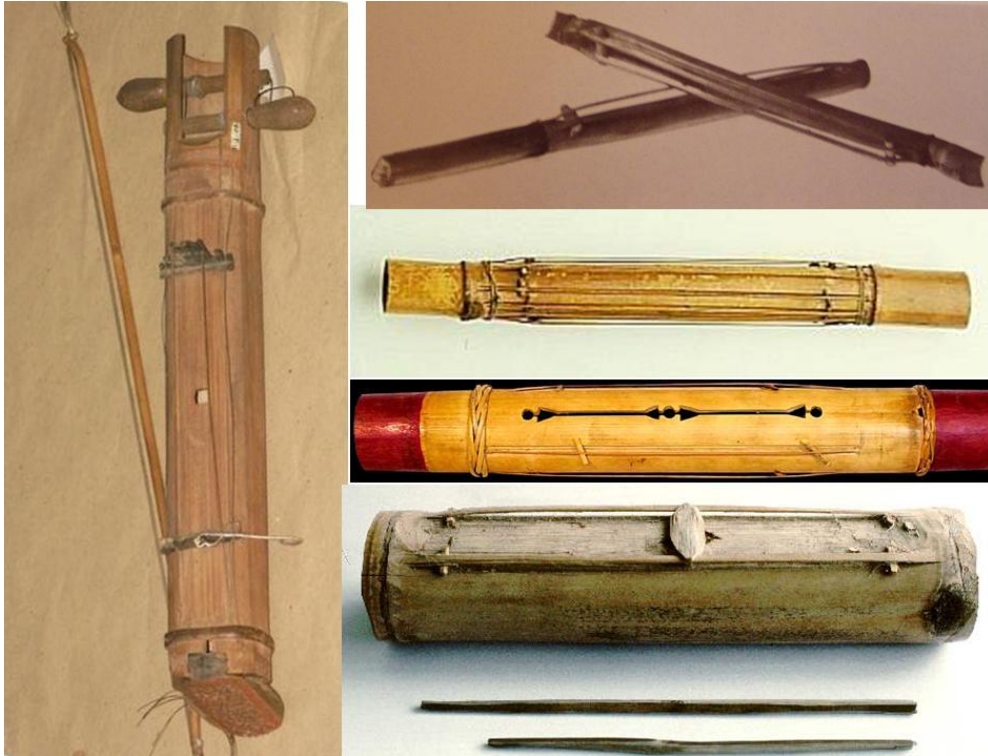
Csutkahegedű (fent jobbra), alatta csőciterák. Bal oldalt bambuszhegedű.

csőciterák, és bambuszhegedűk, melyek szerkezete a csutkamuzsikákkal összevethető. Megtaláljuk ezeket Madagaszkártól a Fülöp szigetekig, pengetős és vonós változatban egyaránt.