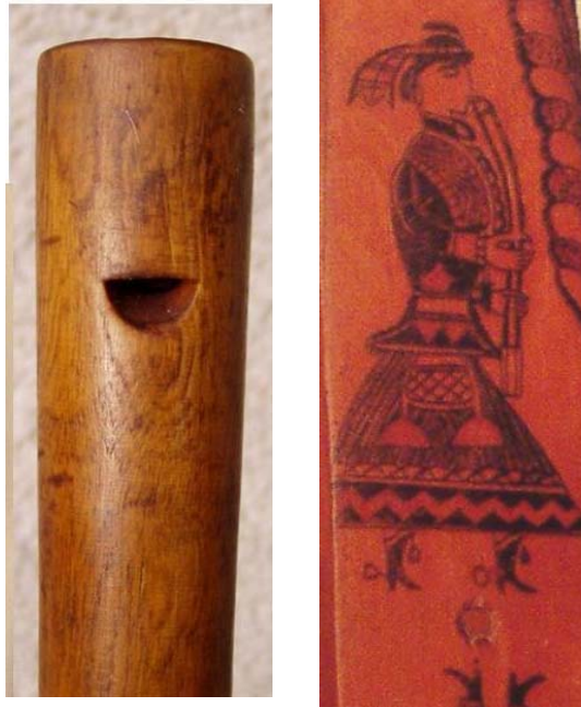
hosszúfurulya sípnyílása és hosszúfurulyán játszó zenész ábrázolása dunántúli mángorlóról

A magyar furulyahagyomány kezdeteit — ezek szerint — a nyelv dugós furulyák jelzik. Európa népei előtt ez a hangszer típus ismeretlen, a furulyákról szóló írásokban és hangszer-enciklopédiákban hiába is keresnénk ilyeneket. Mégsem egyedülálló ez a hagyomány, hiszen megtaláljuk északon élő finnugor nyelvrokainknál is. Ennek alapján egy norvég kutató egyenesen finnugor furulyatípusként könyvelte el a nyelv dugós furulyákat. Mint írja: „furulyatípusunknak már az uráli egység felbomlása, egyes kutatók feltevése szerint i.e. 4000 előtt léteznie kellett.” (Ernst Emsheimer Egy finnugor furulyatípus? A vízimadarak népe 1975. 107-125. o.) Később visszavonta állítását, arra hivatkozva, hogy szláv népeknél is megtalálható a nevezett furulyaféle. Ez a visszavonulás elhamarkodottnak tűnik, és bizony hadilábon áll a logikával is. Az említett „szláv népek” ugyanis éppen a szlovákok, akik — mint tudjuk — évezrede, vagy még annál is régebben élnek együtt velünk a Felvidéken.