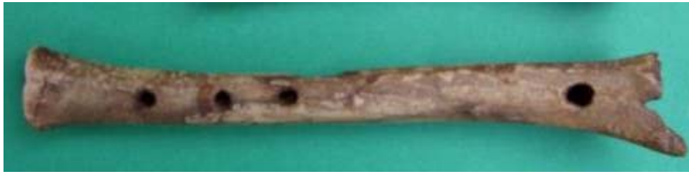
bronzkori csontfurulya Üllőről

Furulya szavunk — szláv szomszédaink szerint — szláv eredetű, a hazai nyelvészek viszont vándorszónak tartják, ami hozzánk román közvetítéssel került. Azt is hozzáteszik még, hogy hangutánzó eredetű ( A magyar nyelv történeti-etimológiai szótára Akadémiai Kiadó 1984 /1/ 991-992. o.)