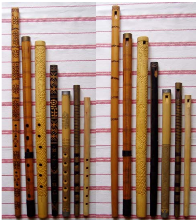
magyar furulyák előlről és hátulról

A magyar nyelvterület legnagyobb részén ismerték és használták a hatlyukú furulyát, melynek különlegessége, hogy szélhasító nyílása nem a hanglyukak oldalán van, hanem a hátulsó oldalon. A számunkra mindennapos, közkeletű furulyaféle azonban egyáltalán nem szokványos a nemzetközi porondon. Sőt. Az egész földkereket áttanulmányozva azt tapasztaljuk, hogy ez a furulyatípus kimondottan a Kárpát-medencére jellemző, itt mindenütt megtaláljuk, míg Európa más térségeiben ismeretlen. Kelet felé Moldváig nyomon követhető, és szórványként előbukkan még Bulgáriában is. Elterjedési területének legnagyobb része tehát a magyar nyelvterülettel esik egybe, e mellett a történelmi időkben a magyarral rokon kultúrájú népcsoportok környezetében bukkan fel. (A bulgárokról tudhatjuk, hogy elszlávosodott hunok, Moldvában pedig a csángó-magyarokon kívül ma román nyelven beszélő besenyő, kun, úz, jász és egyéb rokon kultúrájú népek élnek.) Mindezek alapján bátran nevezhetjük magyar furulyának ezt a hangszert, amihez hasonlót sehol máshol nem találunk a föld kerekén.