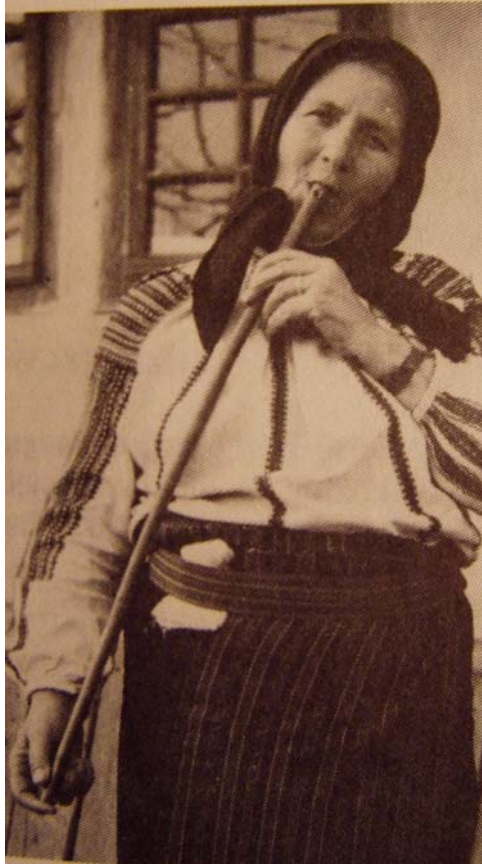
csilinkán játszó csángó asszony

fűzfatilinkóknak . A különbség az, hogy a csilinkába nem tesznek fából faragott dugót, hanem a zenész a saját nyelvét használja dugóként, azzal irányítja a befújt levegőt a szélhasító peremére.