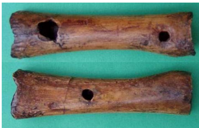
Az istállóskői csontfurulya műanyag rekonstrukciója előlről, és hátulról

A Bükk hegységi Istállóskő barlangjából őskőkori csontfurulya került elő. (Vértés László Istállóskő 1955. 29. o) A jégkorszak végéről, az ún. felső paleolitikumból származó őshangszer barlangi medvebocs combcsontjából készült. A sípon a véletlenszerű letörések mellett három eltérő minőségű és — méretű kerekded nyílás van, amelyek emberi beavatkozás nyomait viselik magukon.