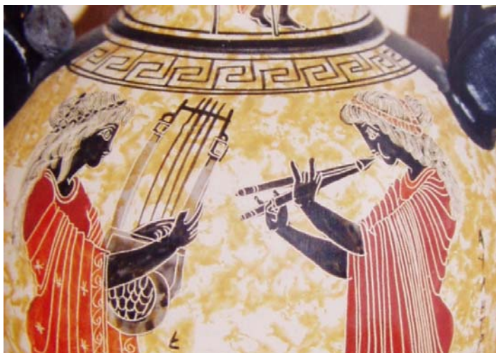
kitáró és tárogató

A tárogató hangszernev tehát azt bizonyítja, hogy a magyar történelem és kultúra sokezer éves múltra tekint vissza. 15 A síp kialakulása legnagyobb valószínűség szerint a Kárpát-medencében történt. Ebből fejlődtek ki évezredek alatt azok a típusok, melyek a középkor legjelentősebb hangszerei voltak (dudák, töröksípfélék). Végül a tárogató adta a mintát annak a két fontos hangszernek is, melyek máig a modern szimfonikus zenekarok elengedhetetlen tartozékai; az oboa és a klarinét.