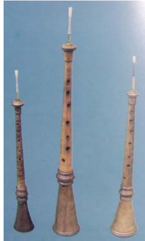
Magyar tárogatók a kuruc korból.