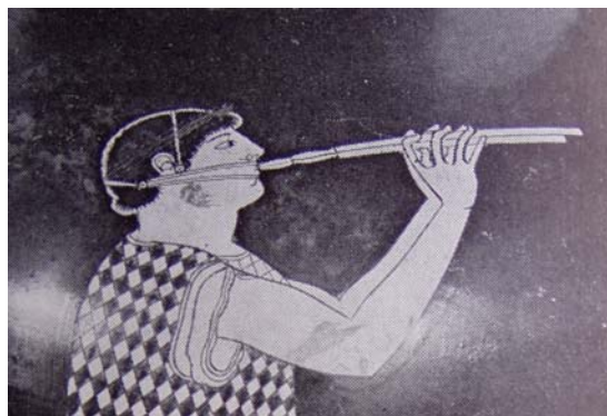
Görög tárogató pofaszorító szíjjal.

A vékonyka szalmasíp és a vastag, hosszú sípszár közötti átmenetet lépcsőzetesen bővülő nádcsövecskék biztosították. Ezt később tölcseresen táguló fémcső helyettesítette, ami az ún. töröksípok kialakulásához vezetett. Ez a nagy hangerejű hangszer már túl sok levegőt igényelt ahhoz, hogy egy ember képes legyen a sípokat egyszerre fújni, ezért a két sípot két ember fújta külön-külön. A sípszáron így már két kéz ujjai voltak elhelyezhetők, a hanglyukak száma itt négy helyett nyolc lett.