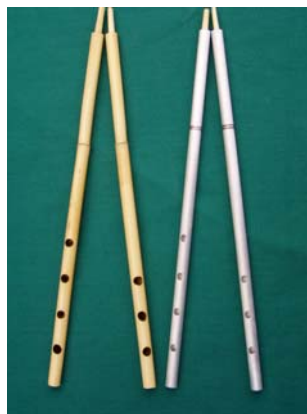
Nádszárú tárogató és az Ur-i ezüstsíp rekonstrukciója

A kettőssípok hagyományos anyaga a nád, ami valószínűsíti, hogy az ezüst csövű hangszerek a nádból készült sípok mintájára készültek. Nádcsővek korábbi használatára utal az a díszítés is, ami az Ur városi kettőssípok csövein látható. A sípszárak felső végétől ujjhossznyira kettős bemetszés található. Ez a bekarcolás a Sumériában használt nádcsővek csomós részét utánozza. E szerint az eredeti, nád sípszárú hangszerek csövein az ennek megfelelő helyen csomó volt, amit belül át kellett fúrni, vagy égetni. 5