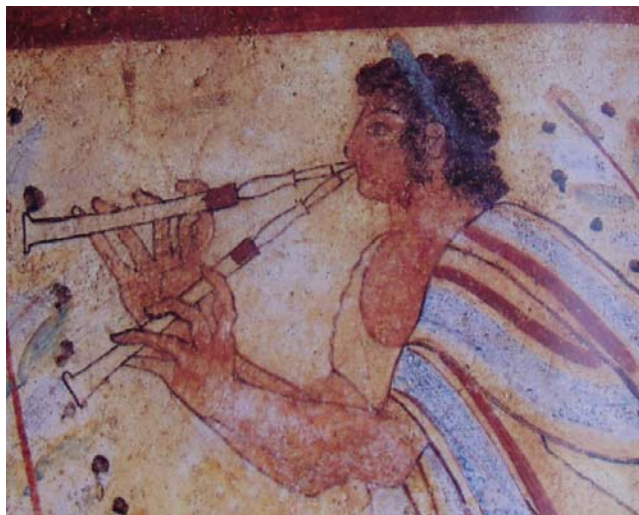
Etruszk tárogató klarinetsípval a tarquiniai sírkamra freskójáról

A képen jól látható, hogy a zenész a sípot az ajkai között tartja és nem a szájüregében, mint azt a görögök szokták, ezért nem is alkalmazhat pofaszorítót. A