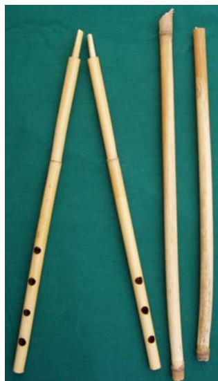
Sumér tárogató és magyar nádcsövek

Az pedig bizonyos, hogy a Duna-Tisza közén olyan nádfaj terem ( Phragmites communis ), amelynek két csomó közti ízei az adott belső átmérő esetén a 25-30 cm-t is kiadják. Ez tökéletesen alkalmas a kívánt hangzású kettőssípok elkészítésére. Ilyen nádcsöveket a Kárpát-medence egész területén bárhol találhatunk különösebb nehézség nélkül. 7