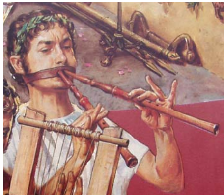
Hamisított rekonstrukciós kép A National Geographicből.

Az ajkak közt szorított sípok helyett a modern festmény síposa láthatóan valami mást tart a szájában. Az idézett cikkben ugyan megjelenik az eredeti etruszk sípos is, de csak egy negyedoldali képen. Ezzel szemben a hamisítvány két teljes oldalt betöltő ábrázolás. Alkalmas arra, hogy a gyanútlan olvasót megtévevse.